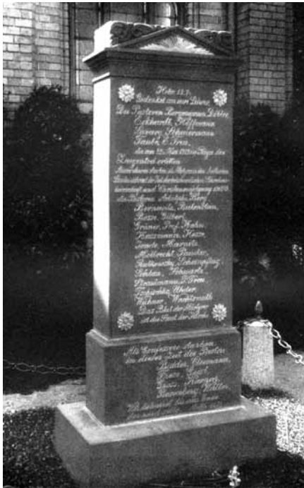
1925. gadā baltvāciešu izgatavotais pieminēklis 1919. gada upuriem. LPSR varas iestāžu likvidēts 1951. gadā.