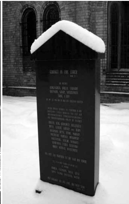
Jaunais pieminēklis, uzstādīts 2006. gadā.